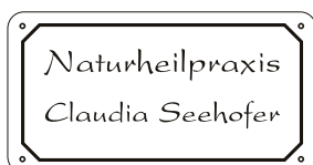
Innenzierrand 8-eckig Abb. Druckschrift Nr. 29 President