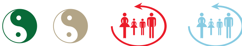
Monade, Farbe wählbar