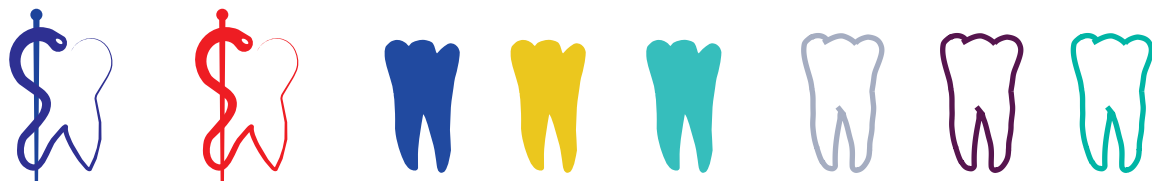
Zahn 4, Farbe wählbar