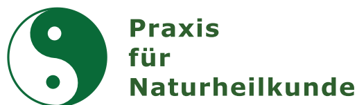
Beispiel Symbol und Text Preis: Symbol + Preis Anzahl der Buchstaben