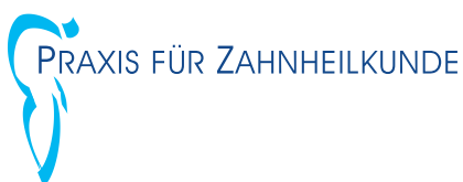
Beispiel Symbol und Text Preis: Symbol + Preis Anzahl der Buchstaben